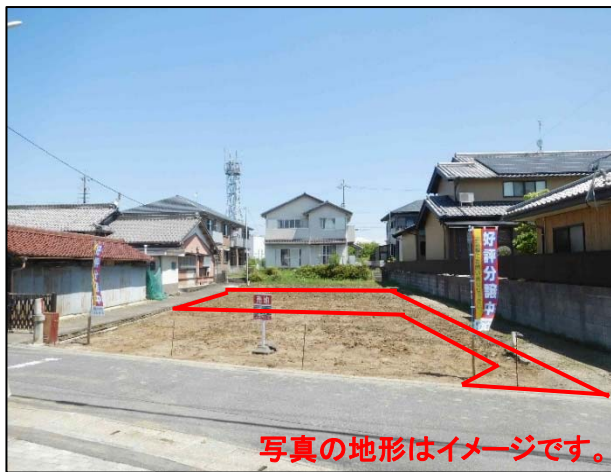
写真の地形はイメージです。